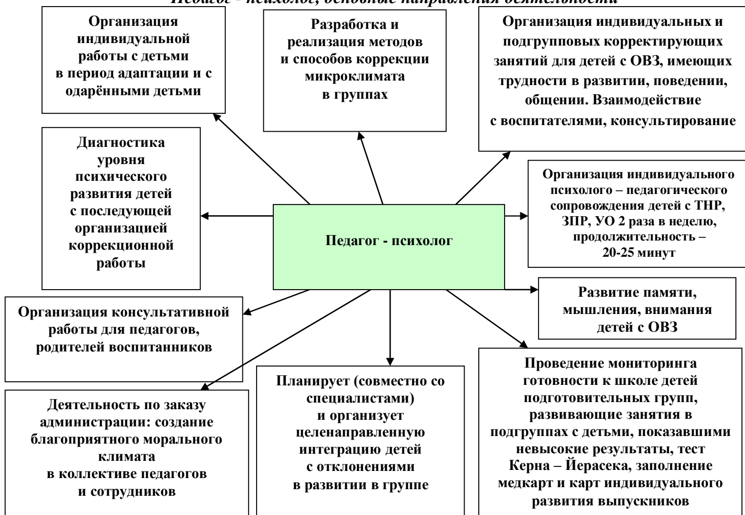
Рис. 2 «Педагог - психолог, основные направления деятельности»